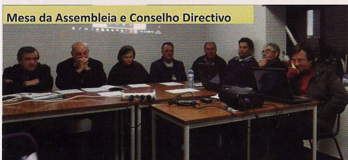
Mesa da Assembleia e Conselho Directivo