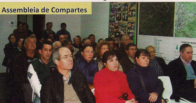
Assembleia de Compartes

A primeira reunião realiza-se até 31 de dezembro para discutir e votar o plano de atividades para o ano seguinte. A segunda terá de ser até 31 de março para a discussão e votação do relatório e contas do ano anterior, e dar conhecimento do parecer da Comissão de Fiscalização. Poderão também haver Assembleias extraordinárias ao longo do ano.