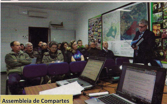
Assembleia de Compartes